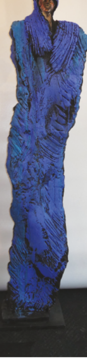
Hauteur : 164 cm