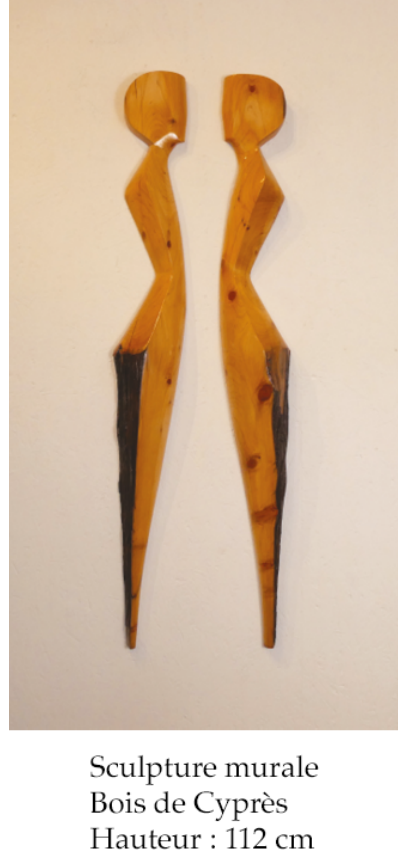
Sculpture murale Bois de Cyprès Hauteur : 112 cm