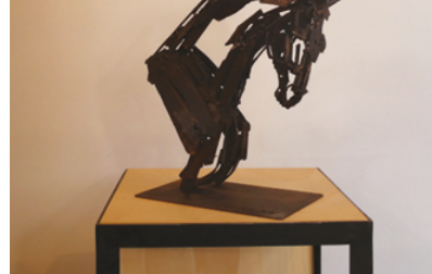
« Mercure » 31 x 32,5 x 12 cm