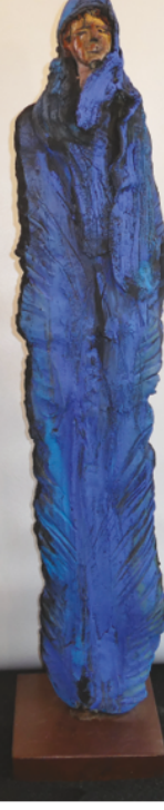
Hauteur : 148 cm