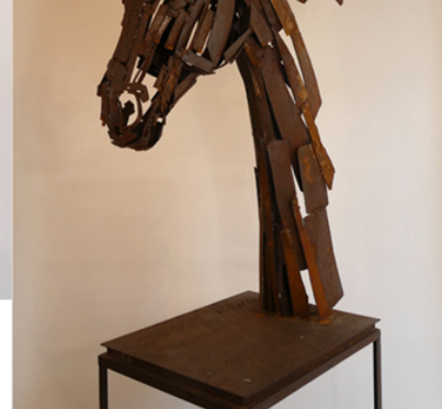
« Aubrac » 106 x 79 x 22 cm