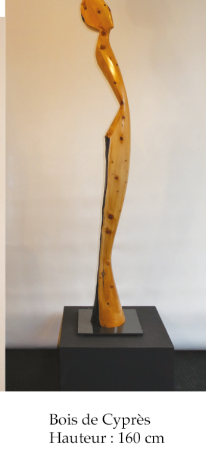
Bois de Cyprès Hauteur : 160 cm