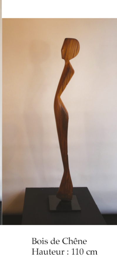
Bois de Chêne Hauteur : 110 cm