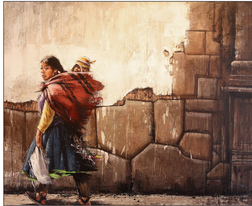
Emmanuel Michel Mur incas - Acrylique et huile sur toile - 130 x 162 cm