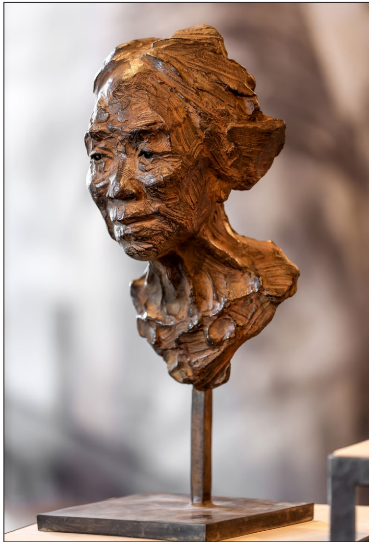
Emmanuel Michel - Gardienne des traditions Bronze patiné - 12 x 31 x 25 cm