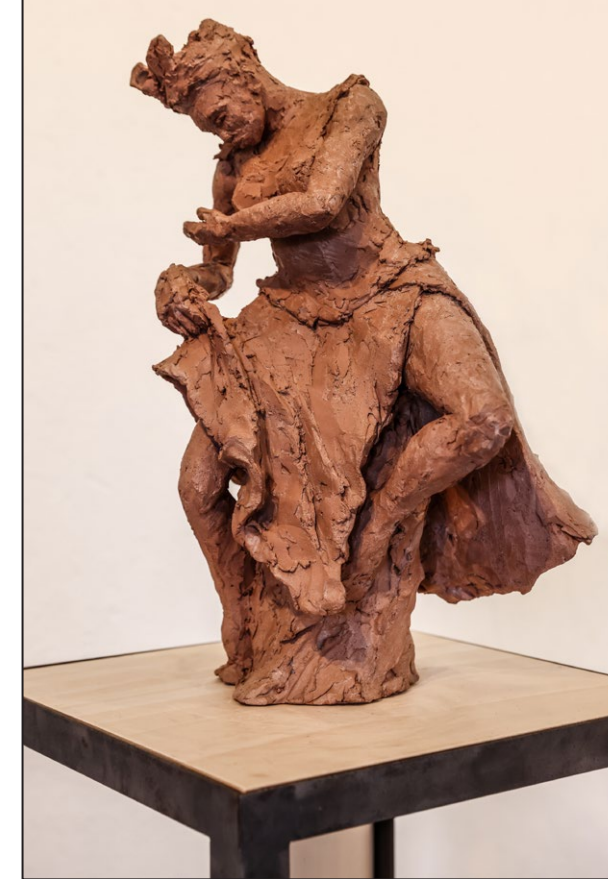
Valem - Sabar - Terre cuite 44 x 30 x 21 cm