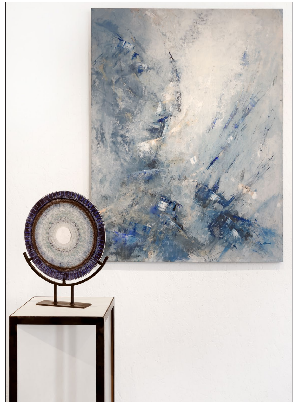
Tableau : Christine Boucey - Chemin de lumière - Huile sur bois - 130 x 97 cm Sculpture : Catherine Dubon - Anatoli - Fusion de verre pigmenté - Diamètre 37 cm

« J'AI TOUJOURS TENU COMPTE DE LA QUALITÉ DU TRAVAIL, DE LA RELATION HUMAINE ET DU REGARD QUE L'ARTISTE PORTE SUR SON TRAVAIL. »