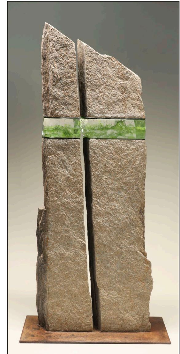
Gérard Fournier - Sans titre Schiste et pâte de verre - 76 x 29 x 5 cm