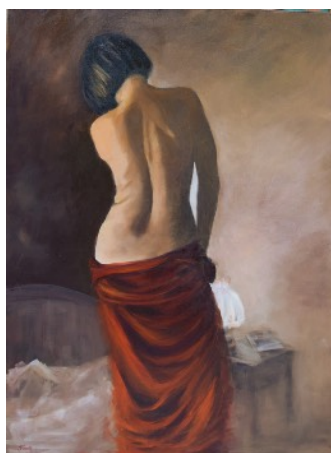
Drapé - Huile sur toile - 81 x 60 cm