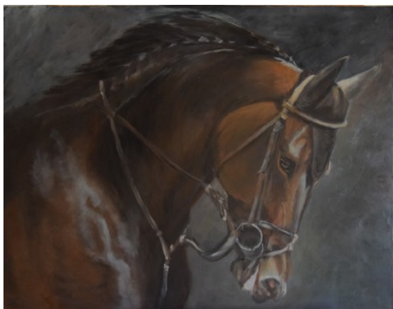
Dressage - Huile sur toile - 60 x 81 cm

Pour la première fois, Jacqueline Ferron et Valem exposent toutes les deux dans un même lieu. Emotion et joie se conjuguent pour préparer cet évènement.