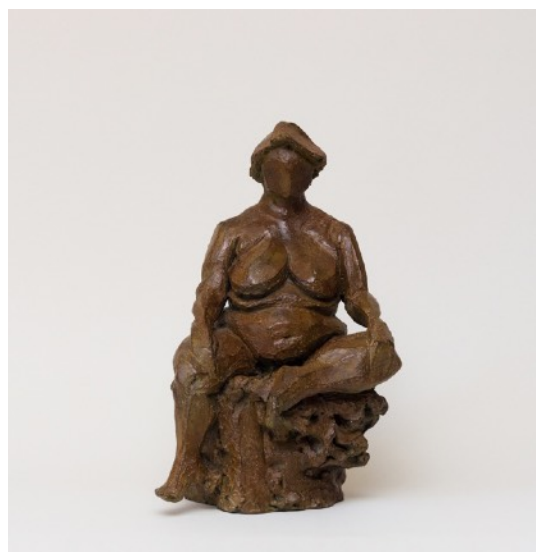
Femme assise - Bronze - 38 x 25 x 15 cm