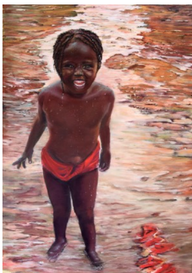
Pieds dans l'eau - Pastel - 70 x 50 cm